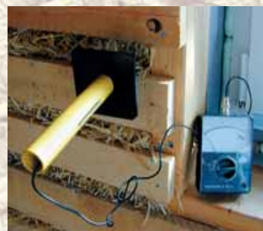
Feuchtemessung an Strowänden

Zur Vermeidung von Fehlerquellen und Optimierung der Anschlussdetails wurden außerdem acht weitere Varianten von Wandaufbauten berechnet und optimiert. Alle Aufbauten erfüllen durch die gute Wärmedämmung Passivhausstandard. Die diffusionsoffene Bauweise verhindert Probleme mit Feuchtigkeit in der Wand. Den Schallschutz betreffend zeigte sich, dass mit zweischaliger Bauweise gute Ergeb-