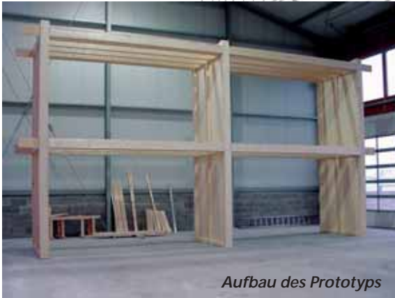
Aufbau des Prototyps